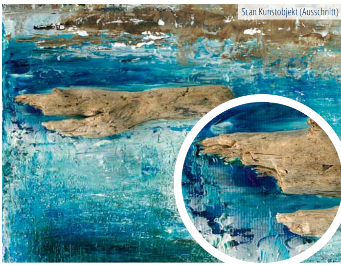
Scan Kunstobjekt (Ausschnitt)