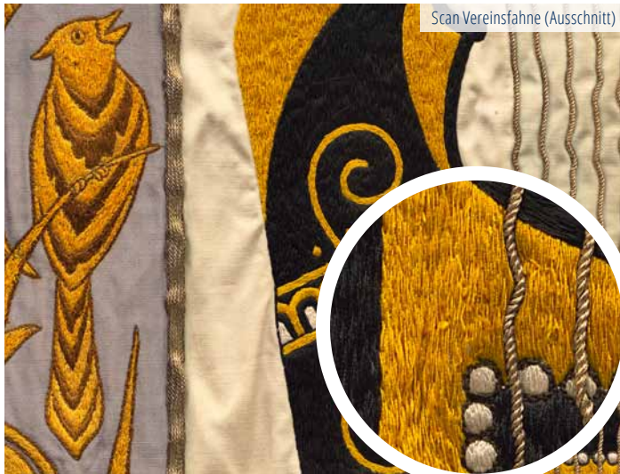
Scan Vereinsfahne (Ausschnitt)