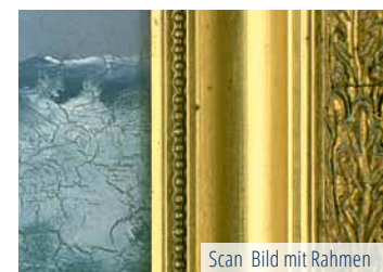
Scan Bild mit Rahmen